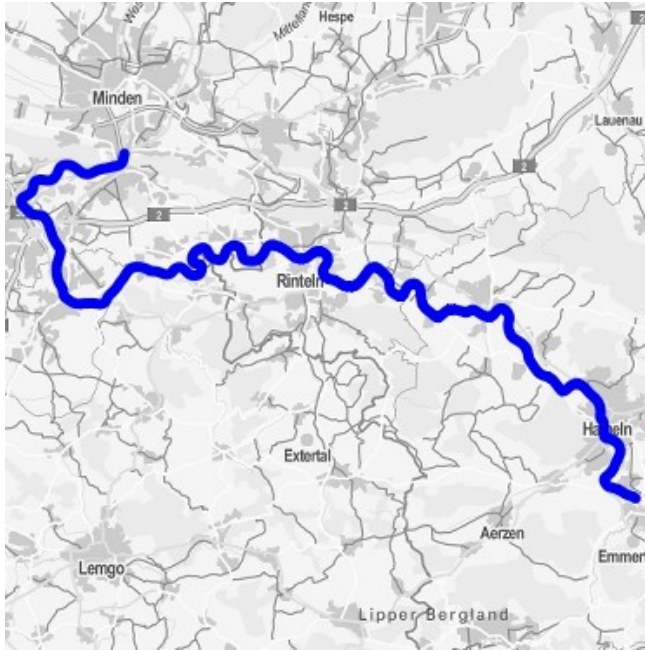
Abbildung 2: Oberflächenwasserkörper 10003 Weser

Der OWK 08001 Weser reicht vom Zusammenfluss von Werra und Fulda bei Hann. Münden (km 0) bis zur Einmündung der Emmer bei Emmerthal (km 128). An dieser Strecke befindet sich das KWG bei Weser-km 124,7. Der flussabwärts folgende OWK 10003 Weser reicht bis zur alten Eisenbahnbrücke im Norden von Porta Westfalica (km 199,8) zwischen den Ortsteilen Barghausen und Neesen.