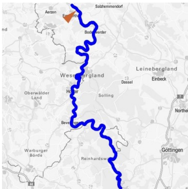
Abbildung 1: Oberflächenwasserkörper 08001 Weser, die Lage des KWG ist durch ein rotes Dreieck kenntlich gemacht

Da sich das Vorhaben nahe an der Grenze zwischen zwei Oberflächenwasserkörpern (OWK) befindet, werden beide in die Betrachtung einbezogen. Die folgenden Abbildungen zeigen die Lage der OWK.